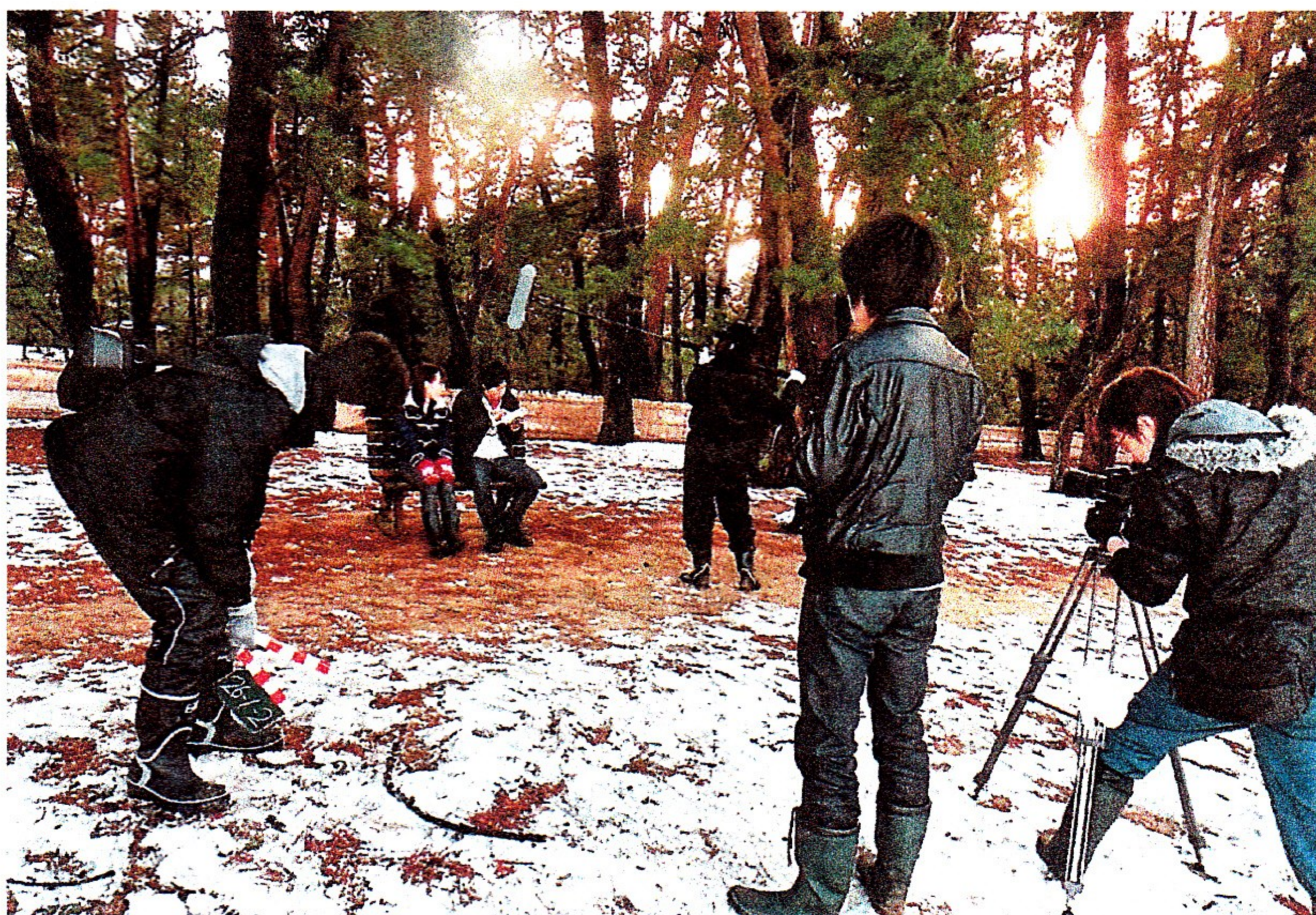
雪が残る気比の松原で行われた映画「SNOWGIRL」の撮影＝2月22日

地元敦賀で撮ることに大きな意味があった。1作目として自信を持って世に出せる作品」と話している。料金は一般前売り千円(当アドレスは、 http://snowgirl-movie.com )、小中高生500円